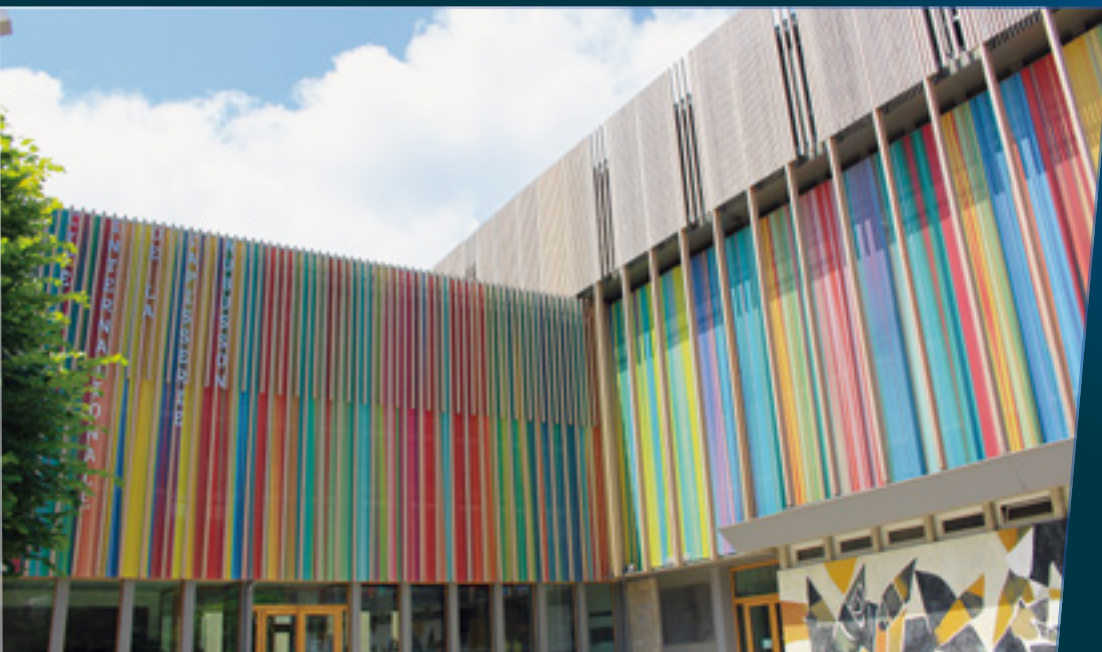
Cité internationale de la tapisserie d'Aubusson - Architecte : Terreneuve architectes