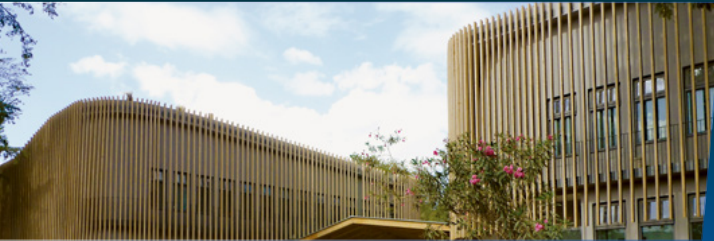
Ambassade de France - Kenya