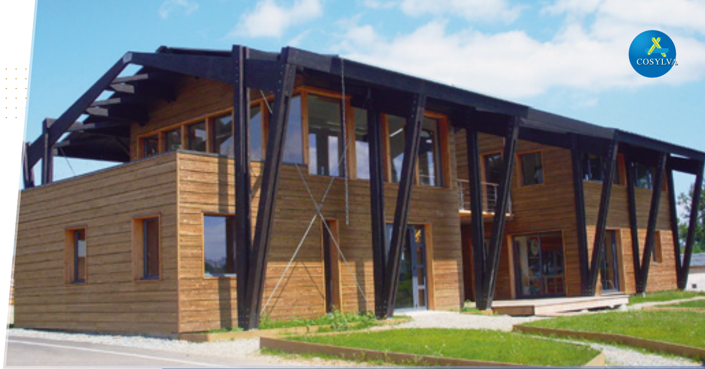
Bureaux Cosylva - Langladure

Hauteur utile : -20 mm par rapport à la section collée. hauteur max : 1 m