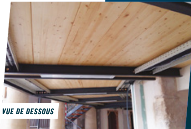
VUE DE DESSOUS